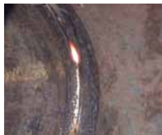
IAC™ (Intelligent Arc Control) - un nuevo proceso para soldaduras MIG/MAG