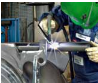
IGC® (Intelligent Gas Control) - ahorros significativos de gases

Además de máquinas diseñadas desde el principio para lograr un bajo consumo energético, ofrecemos tecnologías de vanguardia para reducir costes y aumentar la eficiencia y la calidad: